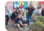
Temps de répit