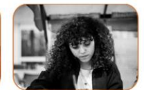
Orientation des JA et leur famille