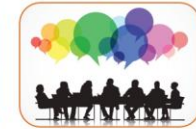
Réunions JA (Professionnels)

Pendant la période de confinement COVID-19, l'association a été vivement sollicitée et a pu proposer des séances de soutien psychologique, individuelles, à distance.