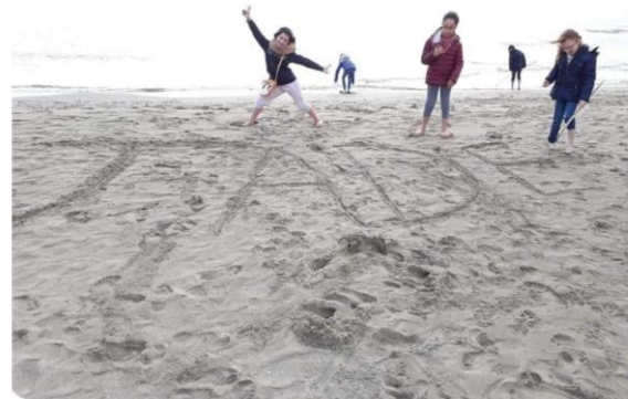
Temps de loisirs et de répit

Les dernières études indiquent qu'il existe un enfant aidant dans chaque classe scolaire de France! Soit environ 500.000 jeunes aidants sur notre territoire.