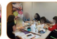
Groupe de parole