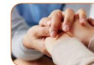
Soutien social et psychologique